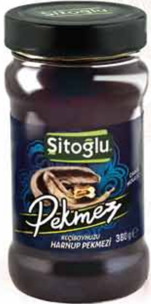
Cam Kavanoz 380 g 8693638025907

Uzmanlar Diyor ki; "Soğuğa Karşı Pekmez Yedirin"