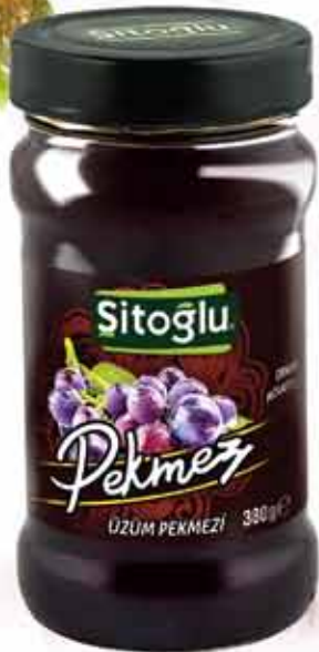
Cam Kavanoz 380 g 8693638025501