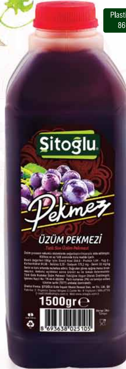
Plastik Bidon 1500 g 8693638025105