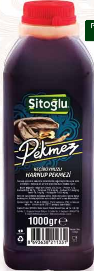
Plastik Bidon 1000 g 8693638211331