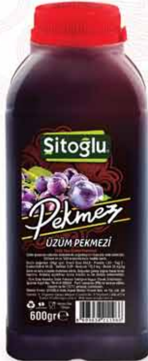
Plastik Bidon 600 g 8693638211966