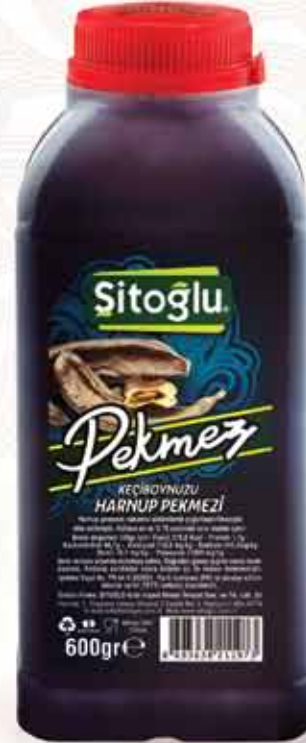
Plastik Bidon 600 g 8693638211973