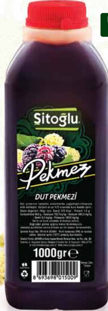
Plastik Bidon 1000 g 8693698015009