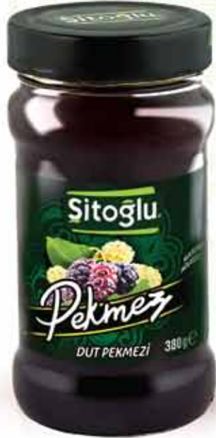
Cam Kavanoz 380 g 8693638004506