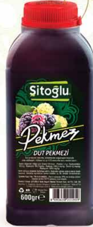
Plastik Bidon 600 g 8693638211959