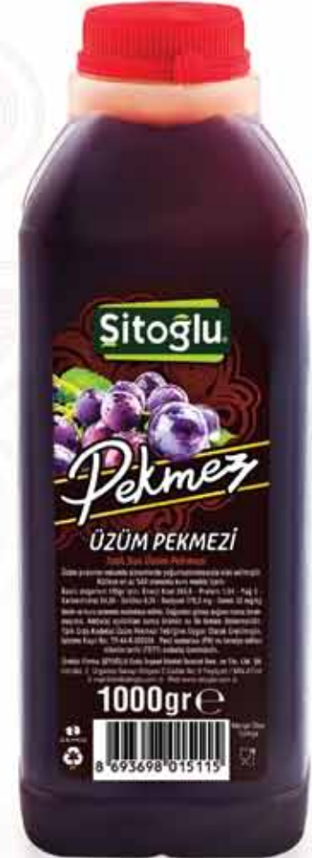
Plastik Bidon 1000 g 8693698015115